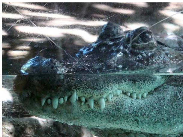
Partie na krokodýla, inspirovaná zřejmě v zoologické zahradě Loro park.

Po týdnu odjela část hráčů, ale přijeli další, kteří přivezli pěkné počasí, takže jsme si užívali sluníčka, chytali bronz a dokonce došlo i na koupání v bazénu.