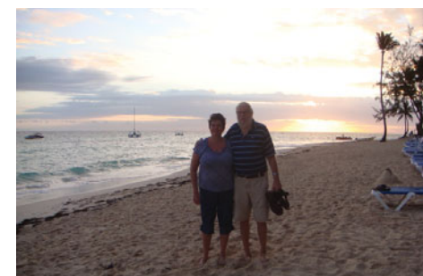
Ráno na pláži