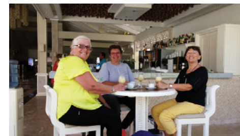
Piña Colada na rozloučenou

Neradi jsme se loučili s teplým a vlídným prostředím hotelu a vraceli se zpátky do únorové zimy. Příští zimu určitě vyrazíme zase někam do tepla.