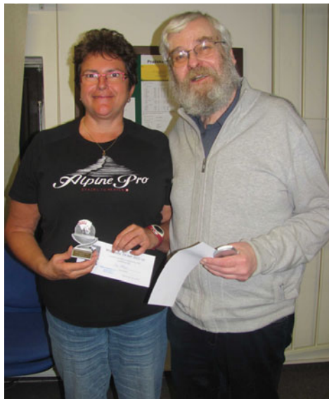
Nejlepší mix a 5. místo