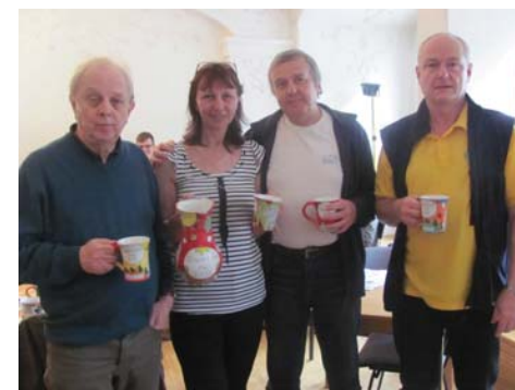
Vítězné družstvo

Ve finále A zvítězilo pražské družstvo ACOL ve složení Textor, Svobodová, Svoboda, Diamant.