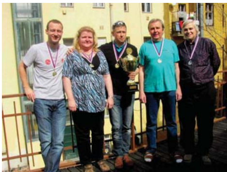
Vítězové 1. ligy