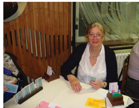
Nejlepší absolventka kurzu

V sobotu večer po závěrečném turnaji jsme rozdělili ceny i medaile a slavnostně zakončili týden.