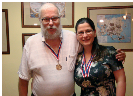
Nejlepší hráči týdne

V hotelu Starý Mlýn jsem se hned domluvila i na příští velikonoční týden v termínu od 4. do 11. dubna 2015. Kompletní výsledky všech soutěží a fotografie jsou uvedené na internetu: www.bridgecz.cz/Eva/rok14/v.htm Nashledanou na příští Velikonoce opět v Rokytnici v hotelu Starý Mlýn.