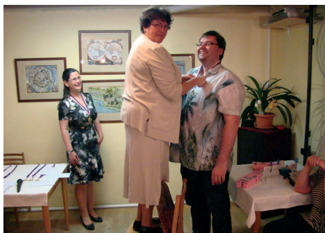
Drobné potíže s udělováním medailí