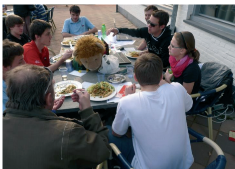
Český tým byl při chuti

Juniorská agresivita v dražbách nezná mezí, a toto předvedli Angličané v devátém kole. Trochu přestřelili a naši porazili závazek za 800. Nevím, jak probíhala dražba v zavřeném, ale Lucka s Michalem přinesli 300 za 5♣xN -2 a zisk 15 IMP. Celkově jsme vyhráli 18:2.