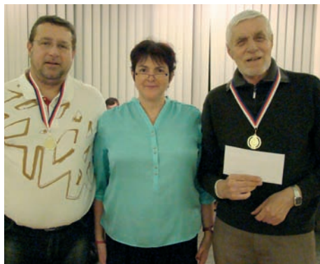
Vítězové finále A

Nejdůležitějším turnajem byl tříkolový hlavní párový turnaj rozdělený podle pořadí v kvalifikaci a semifinále na současně hrané finále A a finále B.