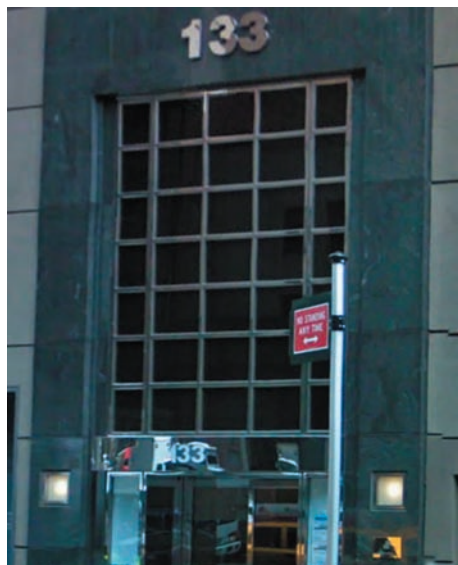
Honors Bridge Club najdete ve čtrnáctém podlaží patnáctipodlažního domu číslo 133 na 58. Východní, nedaleko za rohem Lexington Avenue.

Jak jsi to mohla udělat?“ opakoval jsem, když jsme se usadili vzadu. „Víš, jaké problémy mě kvůli tobě čekají?“ Trochu jsem lhal, doufal, jsem, že pro jednou mi to projde. Tedy když se ještě večer dovolám šéfovi katedry, s nímž jsem dobře vycházel. Naštěstí jsem už neučil, ana-