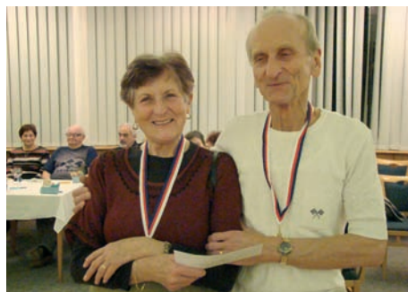
Vítězové finále B